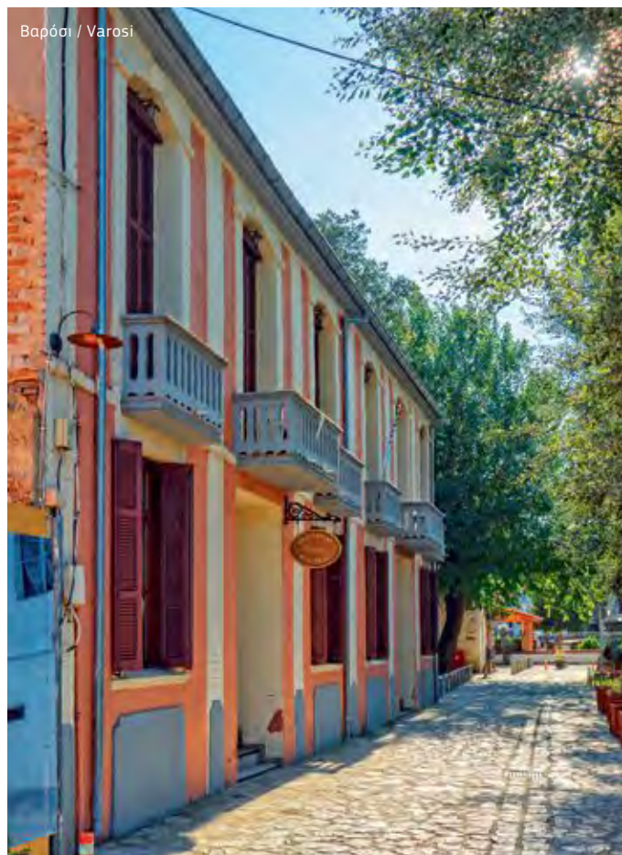
Βαρόσι / Varosi