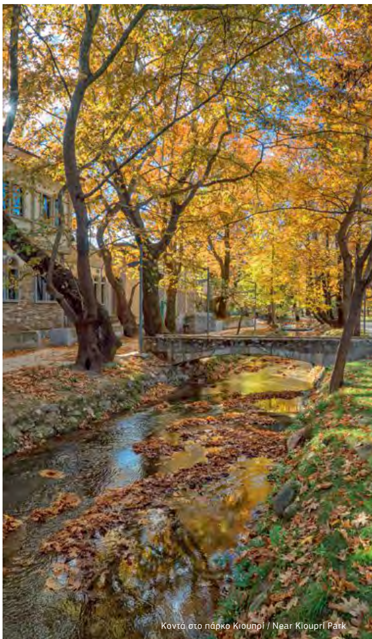
Κοντά στο πάρκο Κιουπρί / Near Kioupri Park