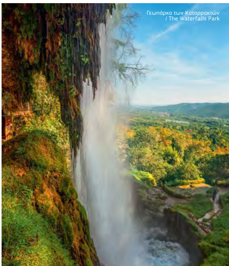
Γεωπάρκο των Καταρακτών / The Waterfalls Park