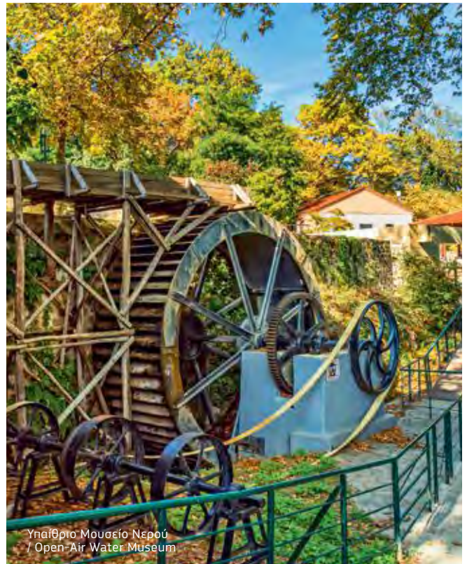
Υπαίθριο Μουσείο Νερού / Open-Air Water Museum