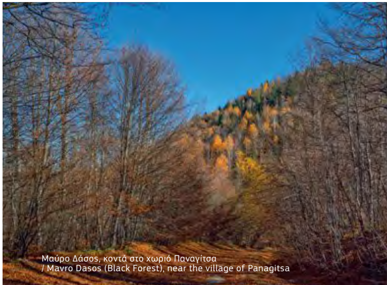
Μαύρο Δάσος, κοντά στο χωριό Παναγίτσα / Mavro Dasos (Black Forest), near the village of Panagitsa

μνήμη των χιλιάδων Σέρβων στρατιωτών που έπεσαν στη Μάχη του Καϊμακτσαλάν το 1916. Από εδώ, όταν η ατμόσφαιρα είναι καθαρή, διακρίνεται ο Θερμαϊκός κόλπος. Στις δραστηριότητες που αναπτύσσονται στο βουνό περιλαμβάνονται ακόμα οι διαδρομές με τζιπ, το μότοκρος και το αλεξίπτωτο πλαγιάς.