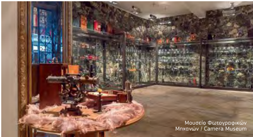
Μουσείο Φωτογραφικών Μηχανών / Camera Museum