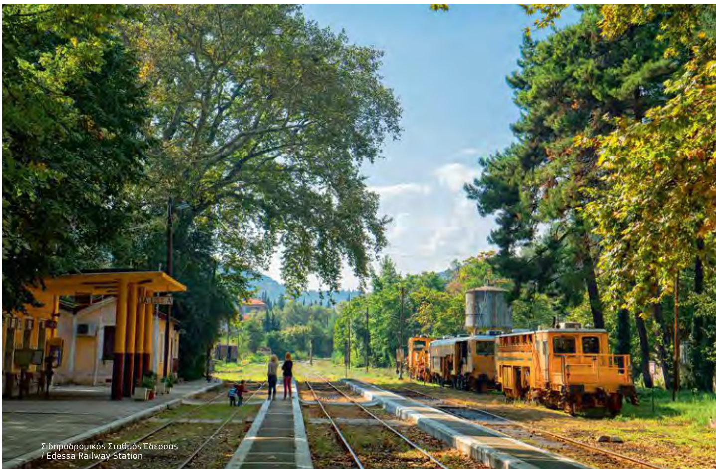
Σιδηροδρομικός Σταθμός Έδεσσας / Edessa Railway Station