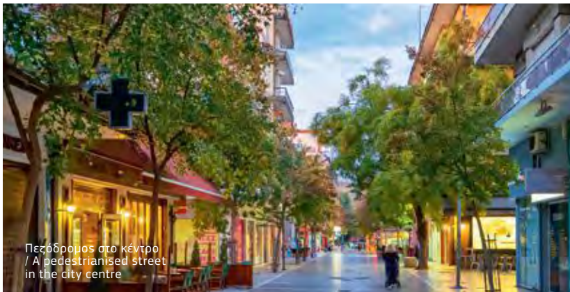
Πεζόδρομος στο κέντρο / A pedestrianised street in the city centre