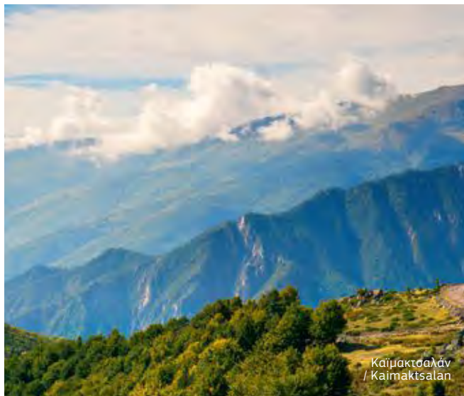
Καϊμακτσαλάν / Kaimaktsalan