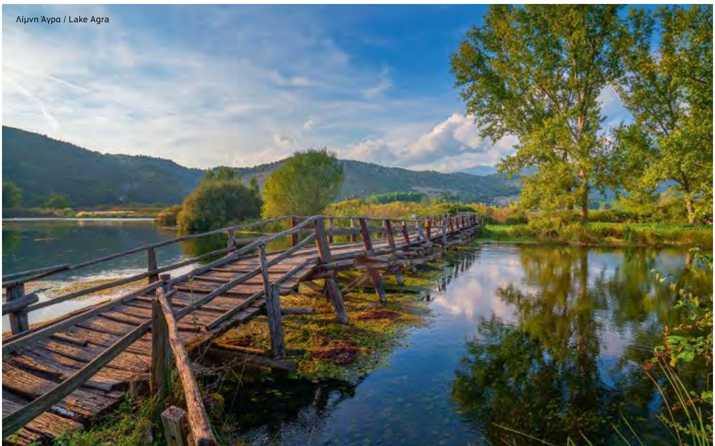
Λίμνη Άγρα / Lake Agra