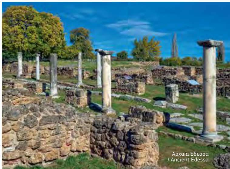
Αρχαία Έδεσσα / Ancient Edessa

Το χιονοδρομικό κέντρο Βόρας-Καϊμακτσαλάν είναι ο απόλυτος πόλος έλξης επισκεπτών της περιοχής. Βρίσκεται σε υψόμετρο από 2.050 έως 2.480 και διαθέτει συνολικά δεκατρείς πίστες διάφορων επιπέδων δυσκολίας. Χάρη σε αυτό ο -άλλοτε ερημωμένος- οικισμός του Αγίου Αθανασίου αναστηλώθηκε και γεμίζει ζωή από τον Νοέμβριο μέχρι τον Μάιο, με δεκάδες καφέ, ταβέρνες, ξενώνες και πολυτελή ξενοδοχεία. Μία από τις ομορφότερες πεζοπορικές διαδρομές του βουνού είναι αυτή που μέσω του δάσους του Βόρα καταλήγει στην κορυφή Προφήτης Ηλίας, όπου βρίσκεται και το ομώνυμο εκκλησάκι αφιερωμένο στη